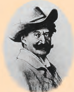
[奥地利]约翰·施特劳斯 1825—1899