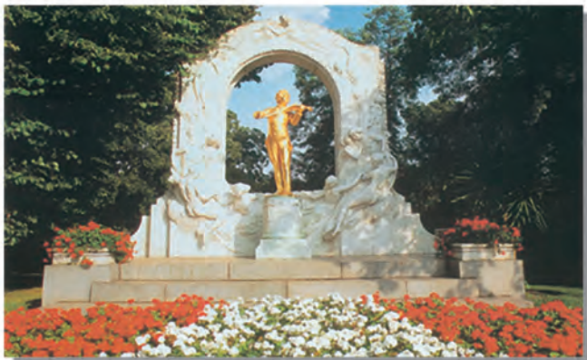
约翰·施特劳斯纪念碑